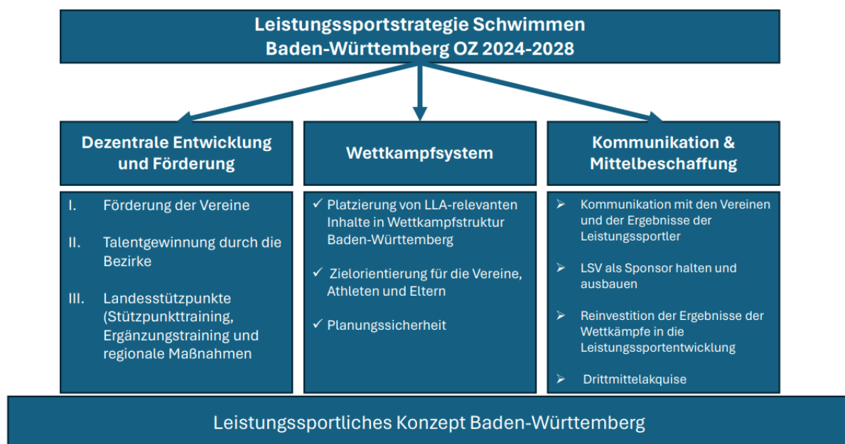
Abbildung 2: Leistungssportstrategie Schwimmen Baden-Württemberg OZ 2024-2028

Durch Unterstützung der Vereine in ihrer Arbeit bezüglich der perspektivischen Entwicklung unserer Talente und der Optimierung der Athleten-Ausbildung kann sich unser Bundesland zu einer der stärksten in Deutschland weiterentwickeln und die nationale und internationale Wettbewerbsfähigkeit der Athleten aus Baden-Württemberg verbessern.